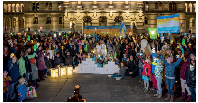
Dépôt de l'initiative pour les glaciers devant le bâtiment fédéral. Einreichung der Gletscher-Initiative vor dem Bundeshaus in Bern.